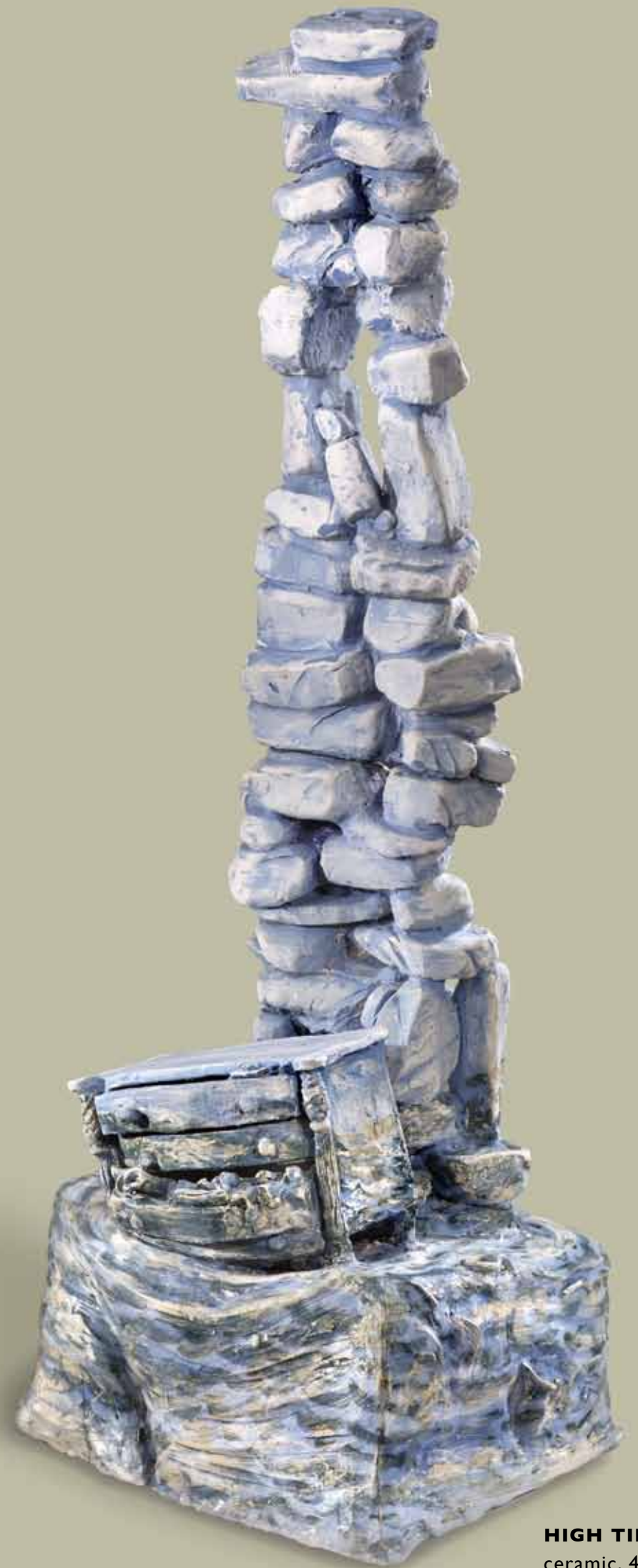
HIGH TIDE, 2002 ceramic, 40"x18"x18"