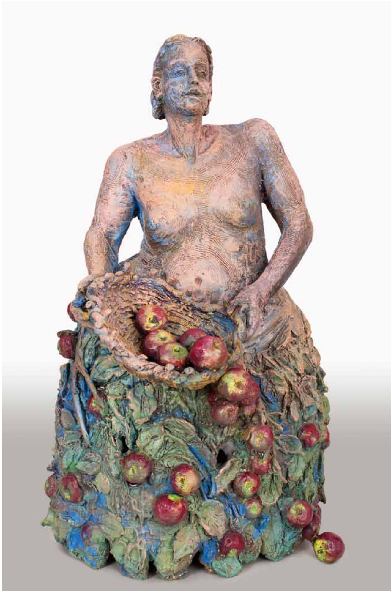
BRONZE APPLE SKIRT 2012, 28"x16"x14" edition of eight