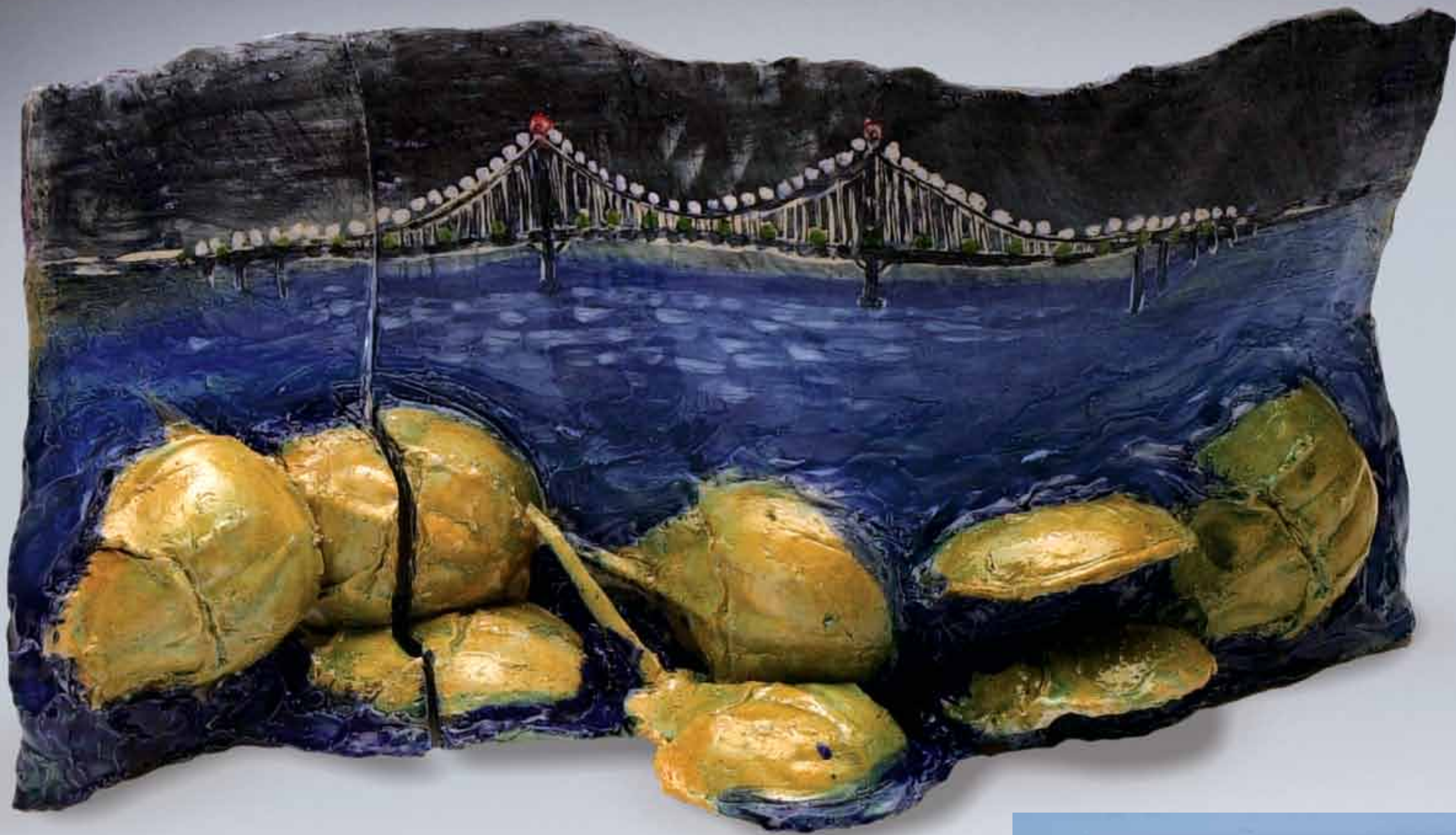
HORSESHOE CRABS AND MOUNT HOPE BRIDGE, 2003 ceramic, 24"x36"x7"