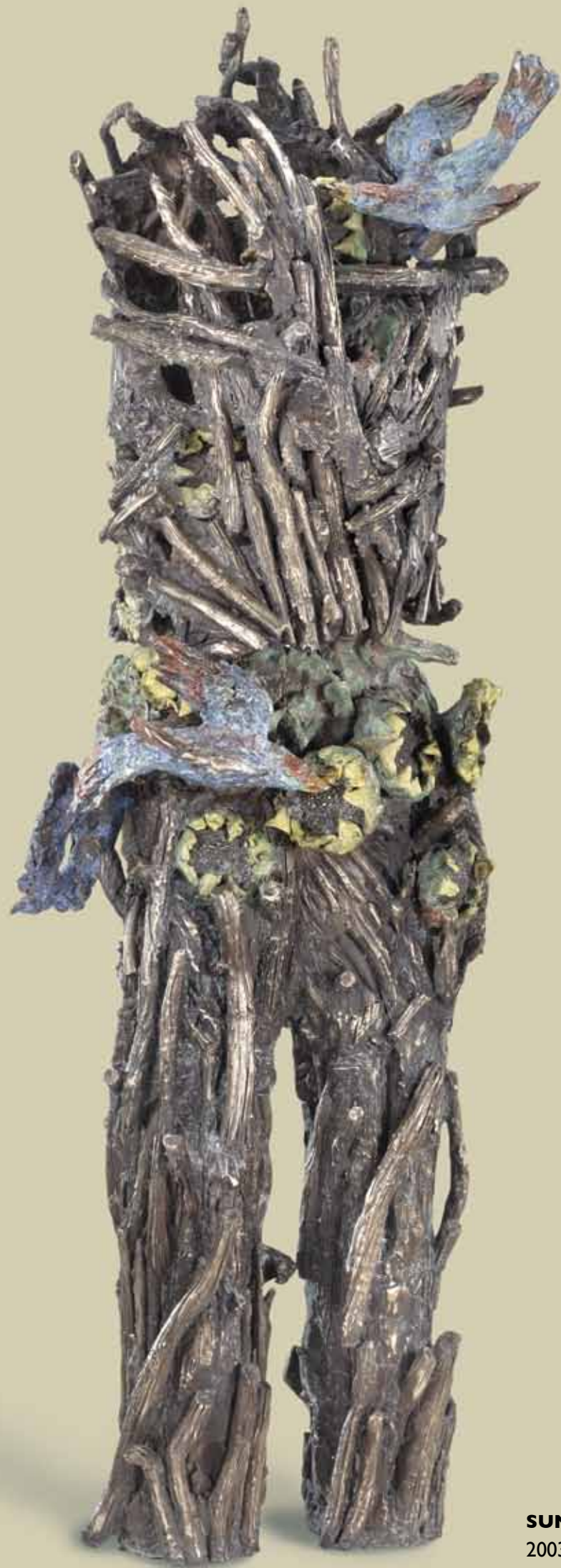
SUNFLOWER AND MUD PANTS 2003, bronze, 40"x18"x18"