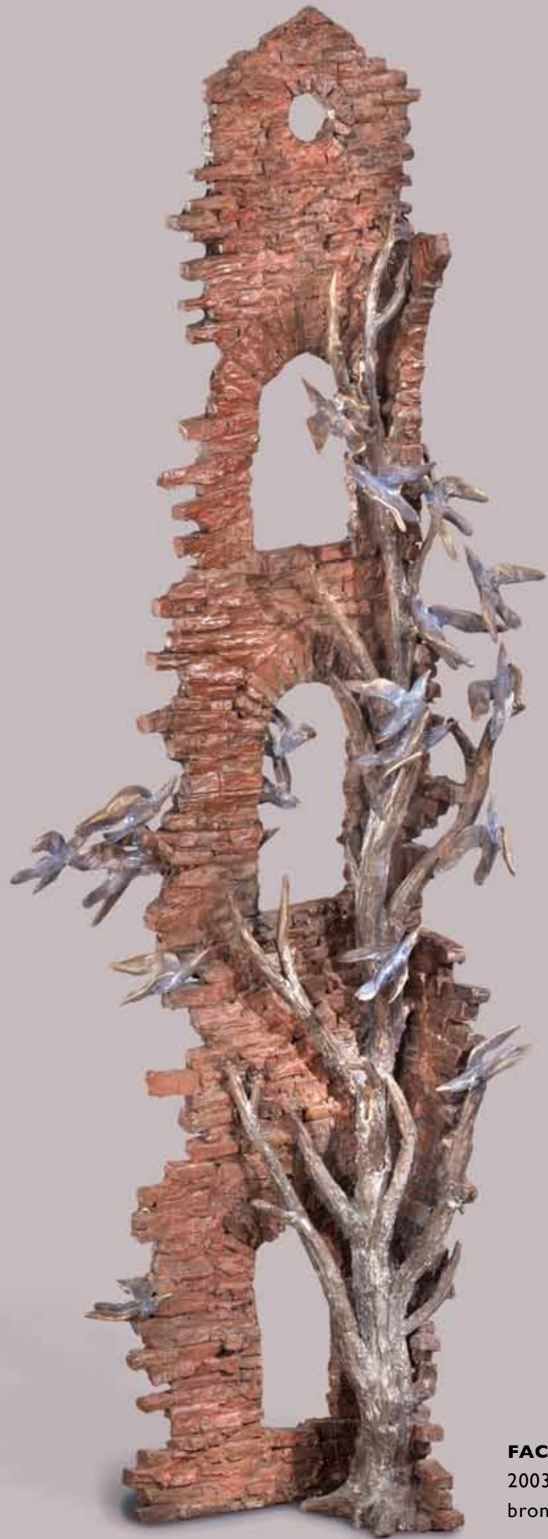
FACTORY GARDEN FOLLY 2003 bronze, 48"x18"x18"